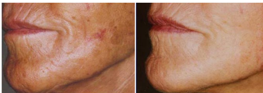
4 Besserung in Bezug auf Fältchen, Lentigines und aktinische Keratosen (zusätzlich konsequente UV-Expositionsprophylaxe); a: vorher, b: nachher.

der wichtigste Aspekt – und das geringe Nebenwirkungspotenzial.